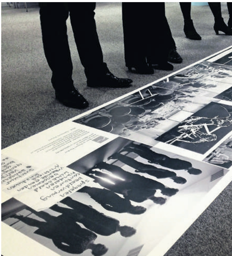
Ambtenaren in Almere buigen zich over de artistieke impressies van hun werkkultuur.