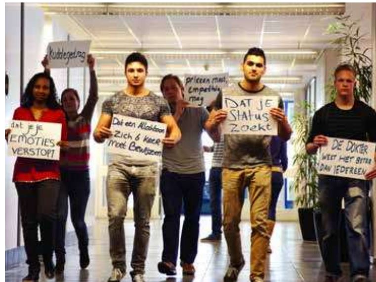
VUmc: De Norm is ...

KPMG werkte de afgelopen vijf jaar samen met meer dan 25 kunstenaars, onder andere om de innovatiekracht van medewerkers te vergroten, innovatieruimtes te ontwerpen en concepten voor events te ontwikkelen. Aan de hand van storytelling leren theatermakers medewerkers anders omgaan met klantcontact en acquisitie. Kunstenaars spelen bovendien een grote rol bij het versnellen van de discussie over diversiteit.